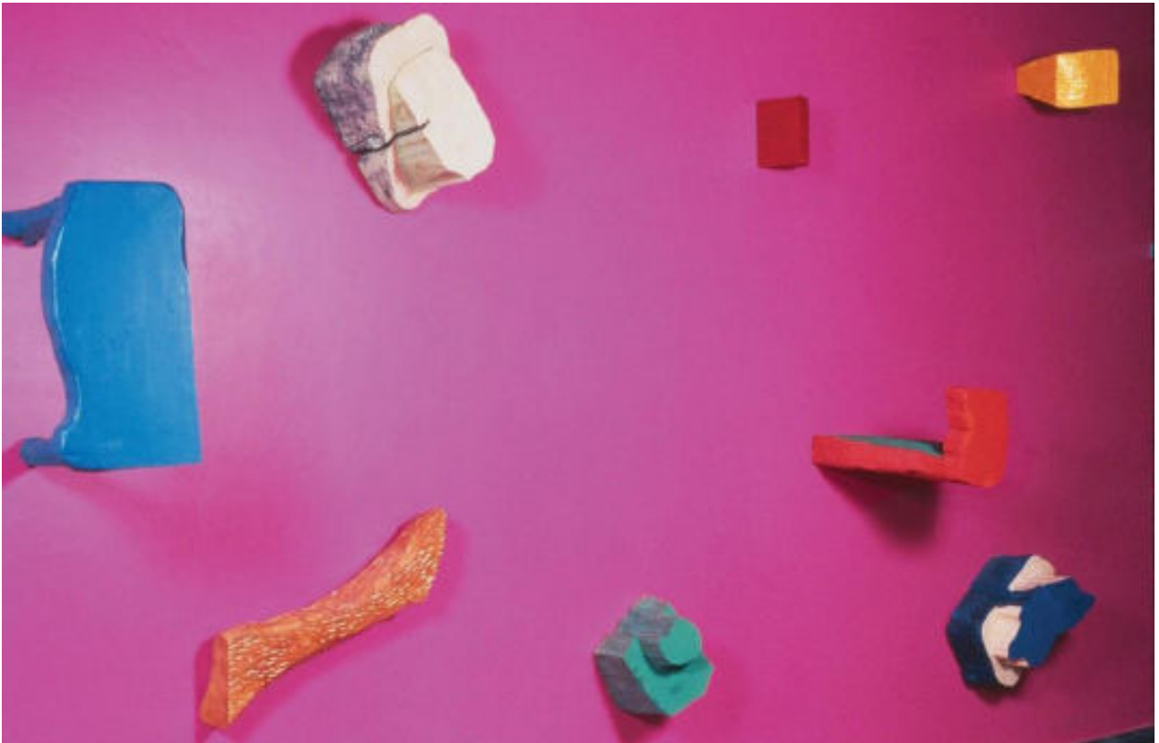
« Mur rose » (détail d'un mur de 10 m) Glycéro et bois peints. Coll. MAC Marseille