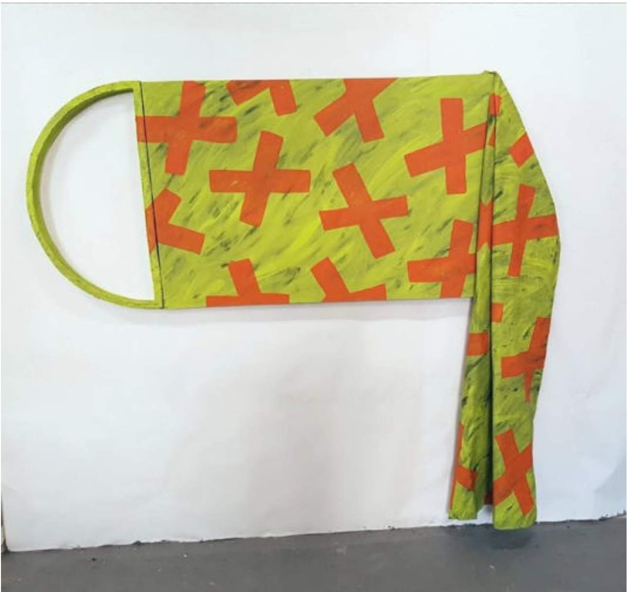
« A la traine » 235 x 200 x 4 cm - acrylique sur toile et bois peint - 2018.