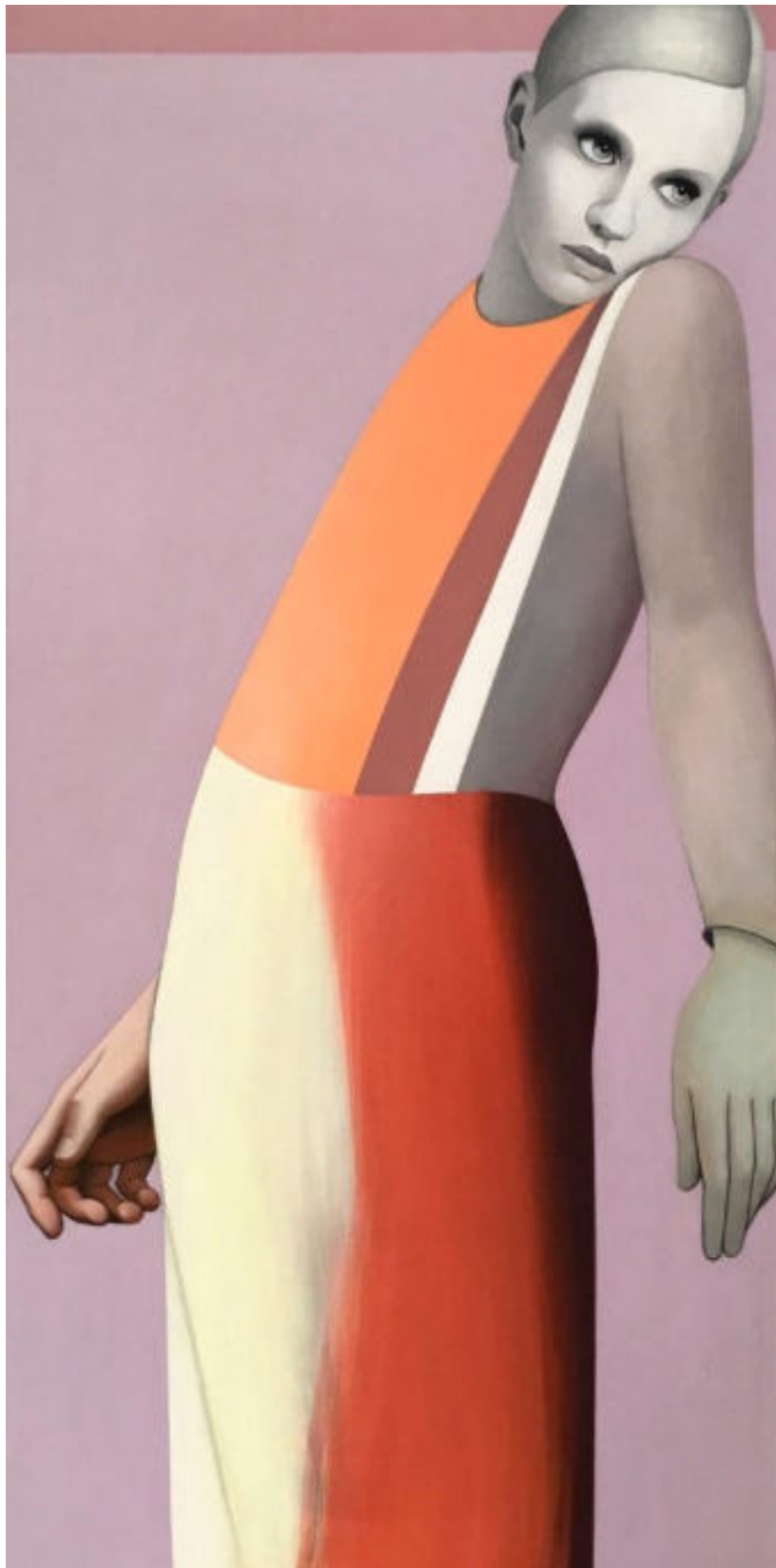
« AHF » 150 x 75 cm - Colle et cire sur toile - 2017.