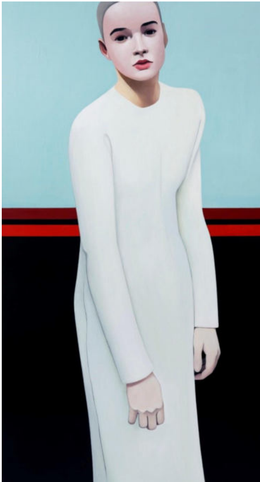
« Laurent H2 » 170 x 91,5 cm, colle et cire sur toile, 2013.