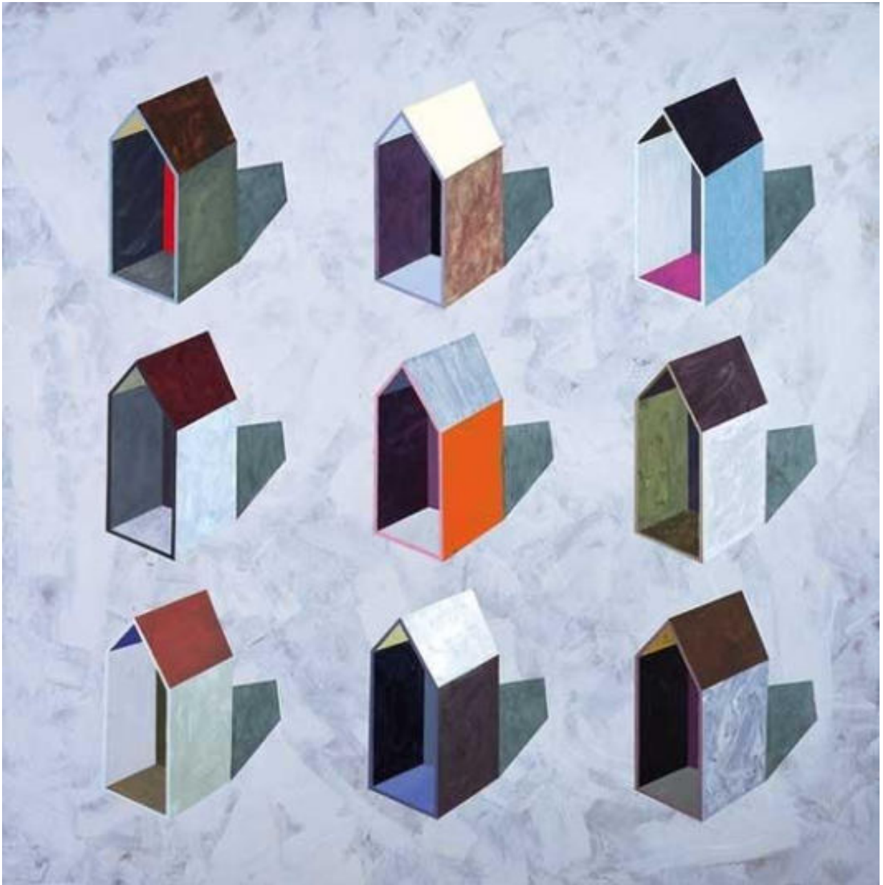
« Neuf maisons - 2 - » 195 x 195 cm, acrylique sur toile, 2004