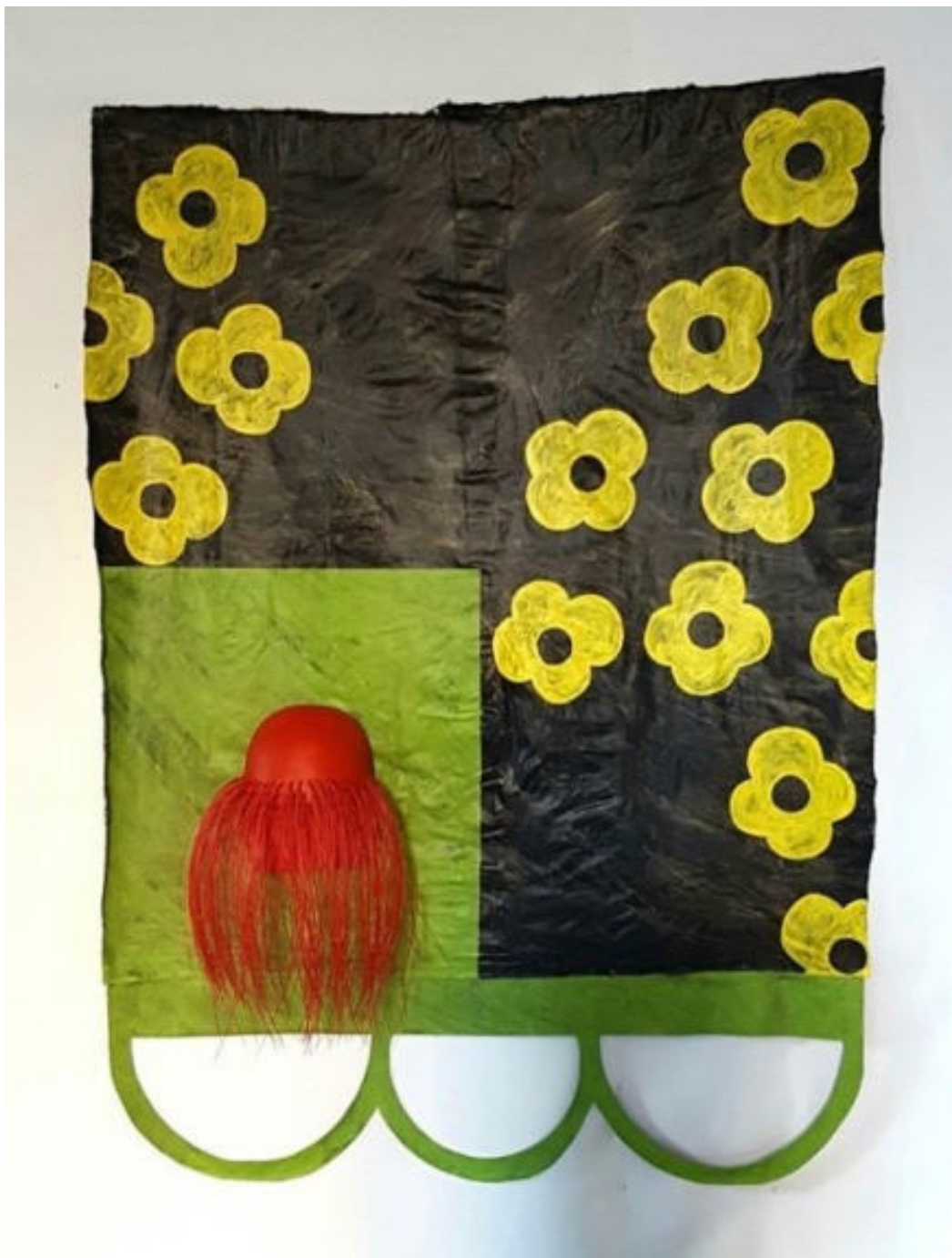
« Paysage et sculpture rouge » 164 x 122 x 23 cm - acrylique sur toile, bois peint et matière plastique - 2018