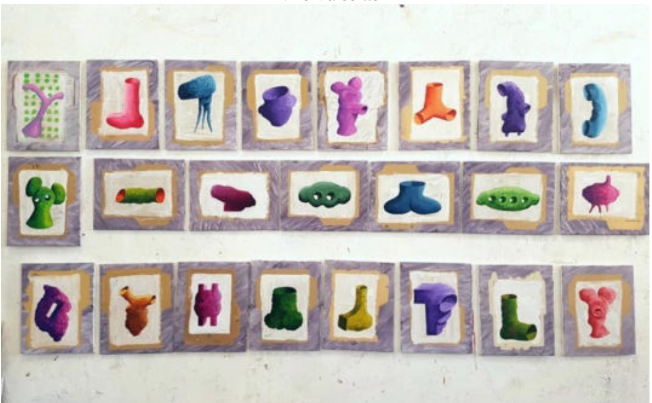
«Vue d'atelier - sans titre » 27 x 41 cm chaque - acrylique sur toile, 2017 / 2018.