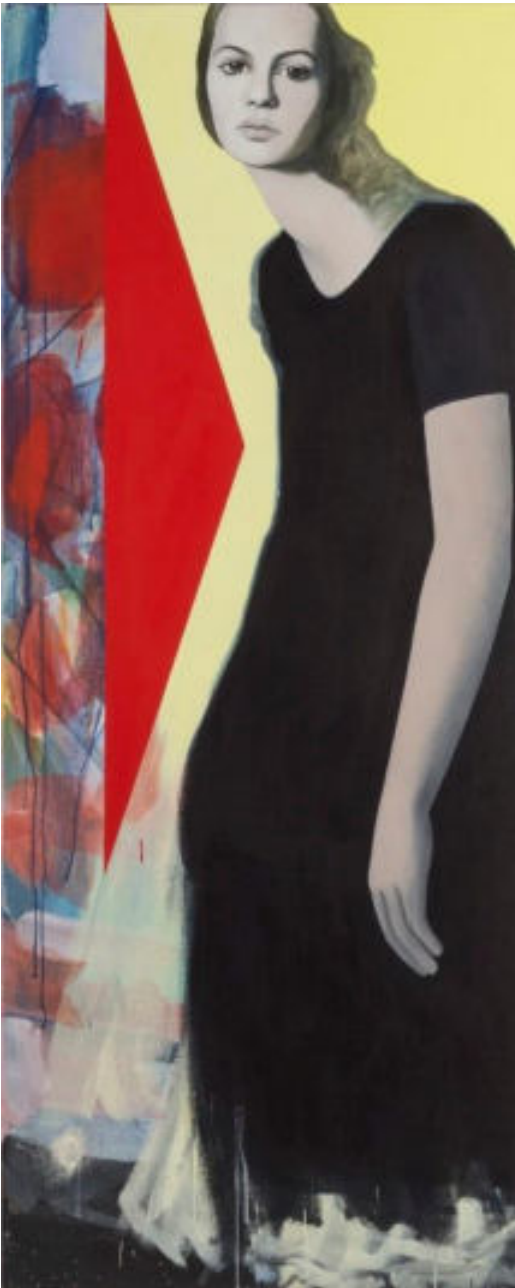
« Triangle » 180 x 73 cm, colle et cire sur toile, 2016.