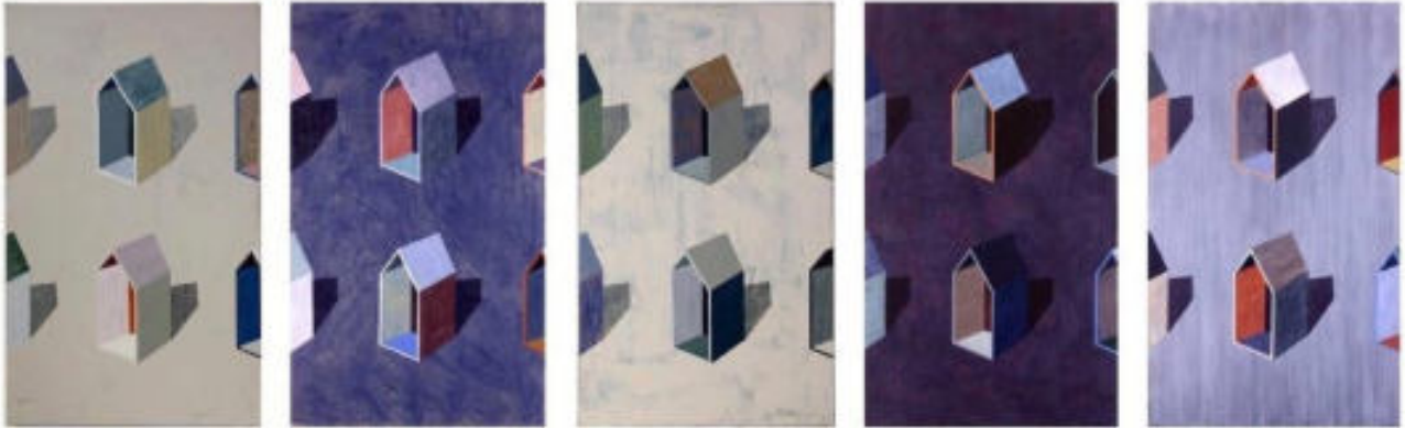
« Maisons mères polyptyque 2 » 160 x 540 cm, acrylique sur toile, 1998/2017