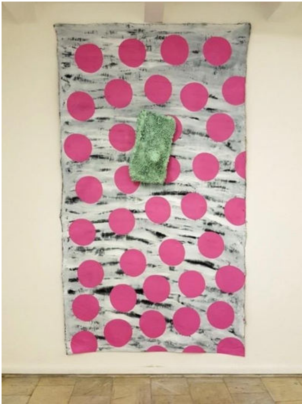
« Protubérances sur cercles roses » 276 x 153 x 35 cm - acrylique sur toile et matériaux composites - 2017.