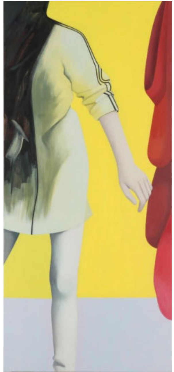
« ADI » 180 x 81 cm, colle et cire sur toile, 2016.