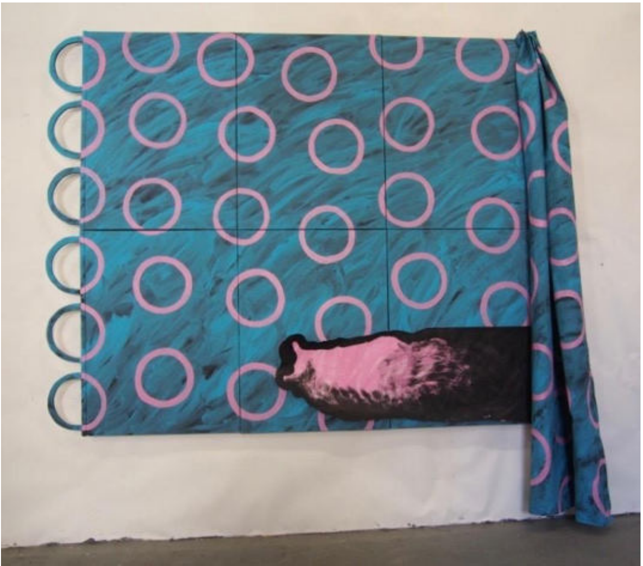
« Fenêtre et cercles roses » 210 x 192 cm - acrylique sur toile et nous découpé - 2018.