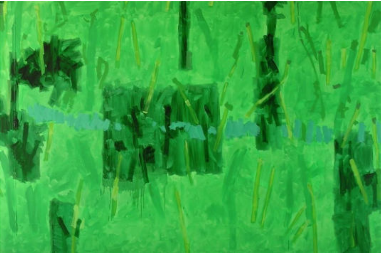
« Photographie d'une petite rivière » 200 x 300 cm, acrylique sur toile, 2013.