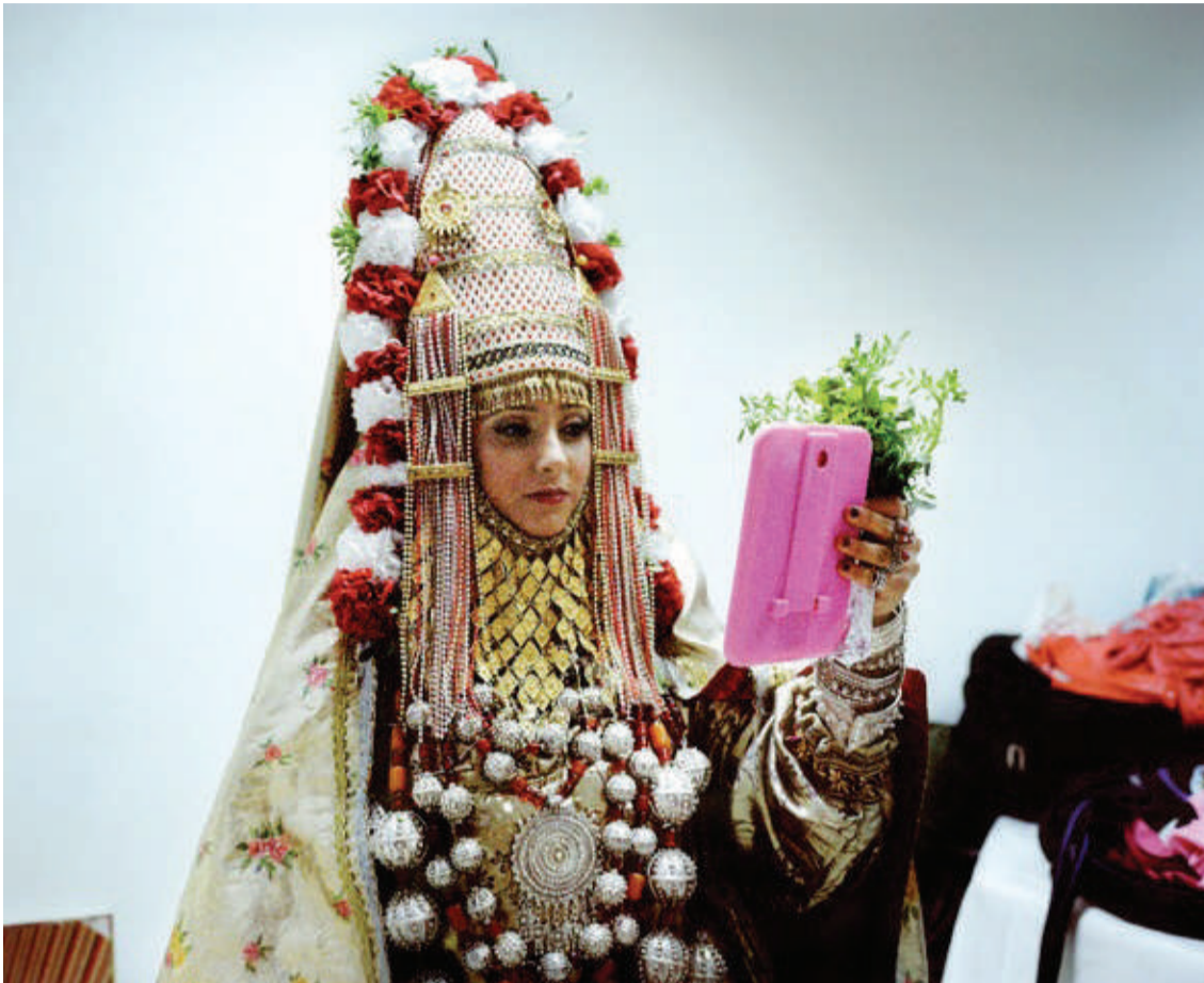
Valentine Vermeil Série Bab El, 50 x 60 cm

À l'occasion de la période de Noël, treize structures artistiques membres du réseau marseille expos, en partenariat avec les Galeries Lafayette de Marseille Saint-Ferréol, organisent la quatrième édition du Christmas Art Market , qui se tiendra à la Galerie du 5ème, du samedi 22 novembre au samedi 20 décembre 2014.