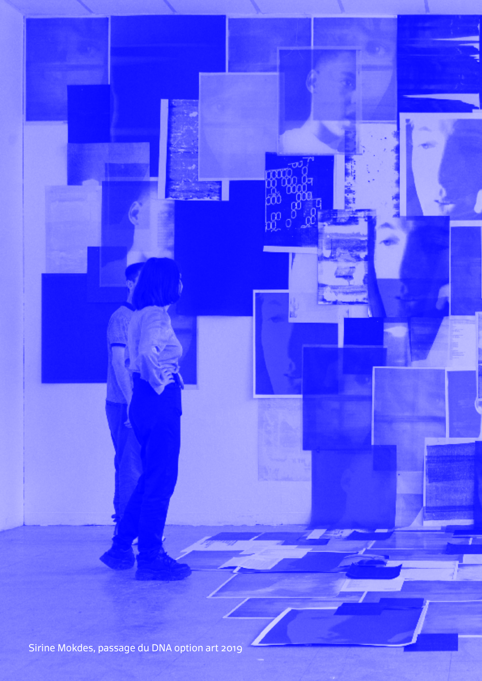
Sirine Mokdes, passage du DNA option art 2019