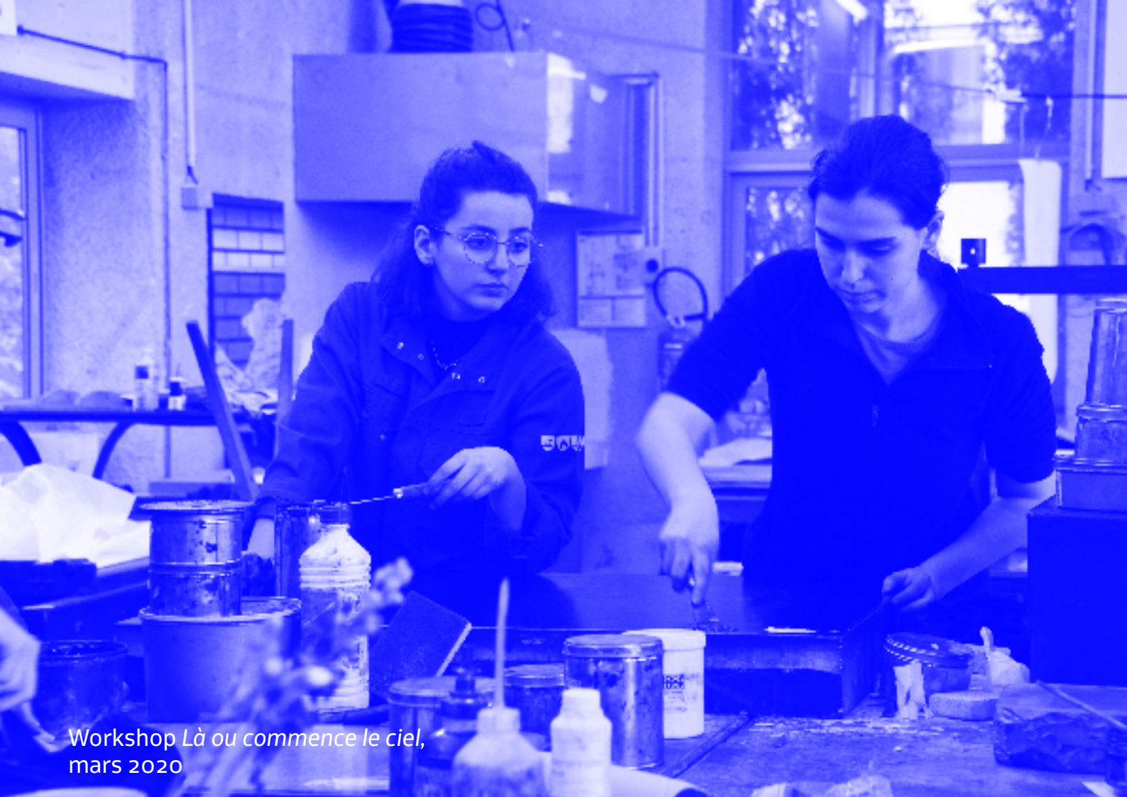
Workshop Là ou commence le ciel , mars 2020