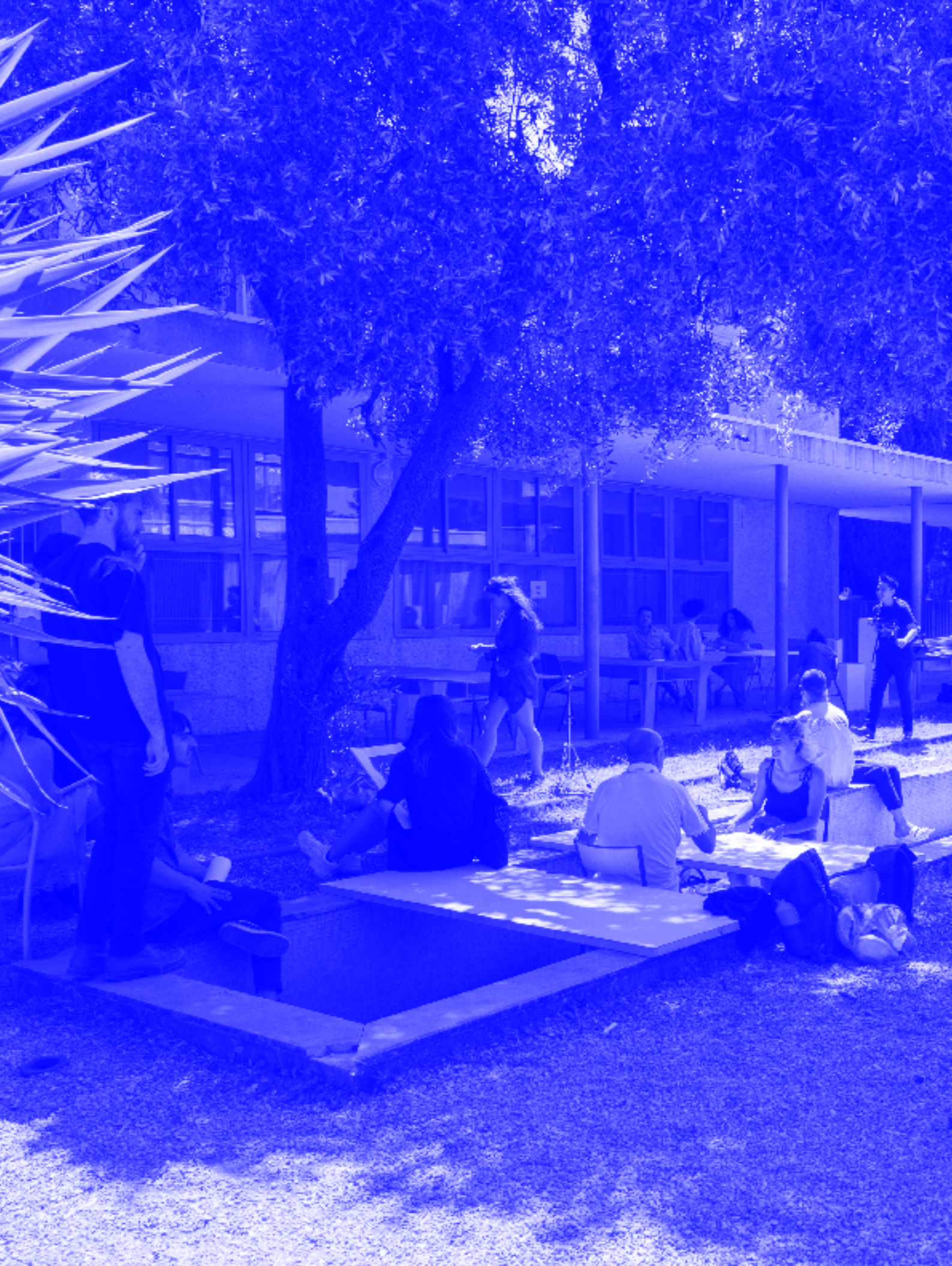
Journée Speed dating , année 1, juin 2019