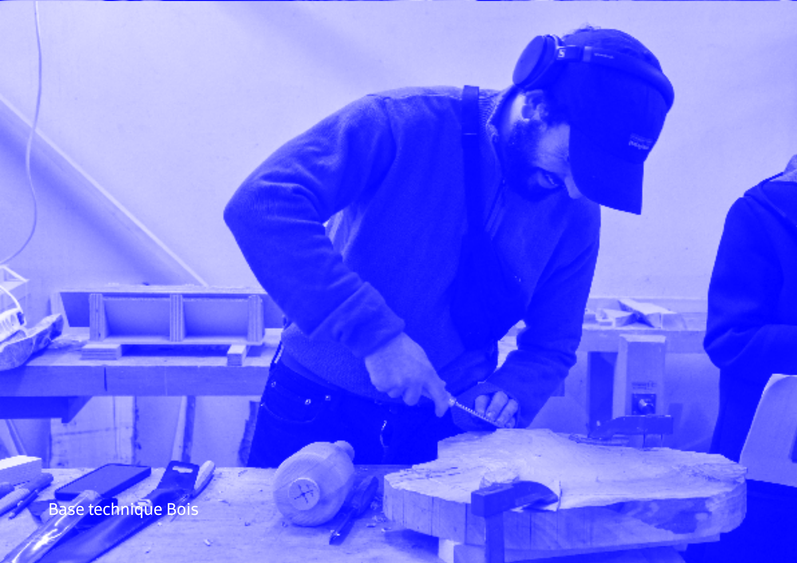
Base technique Bois