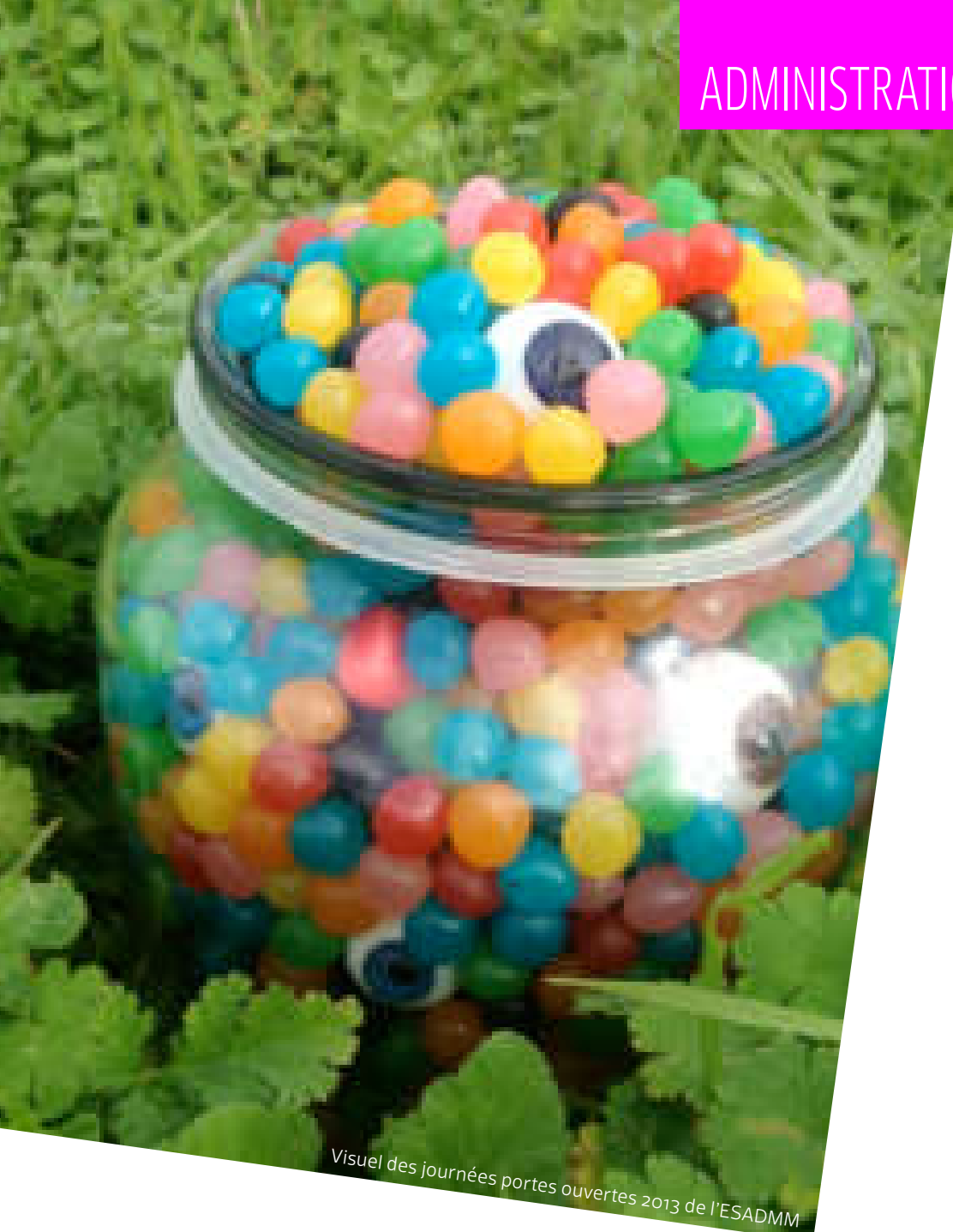
Visuel des journées portes ouvertes 2013 de l'ESADMM