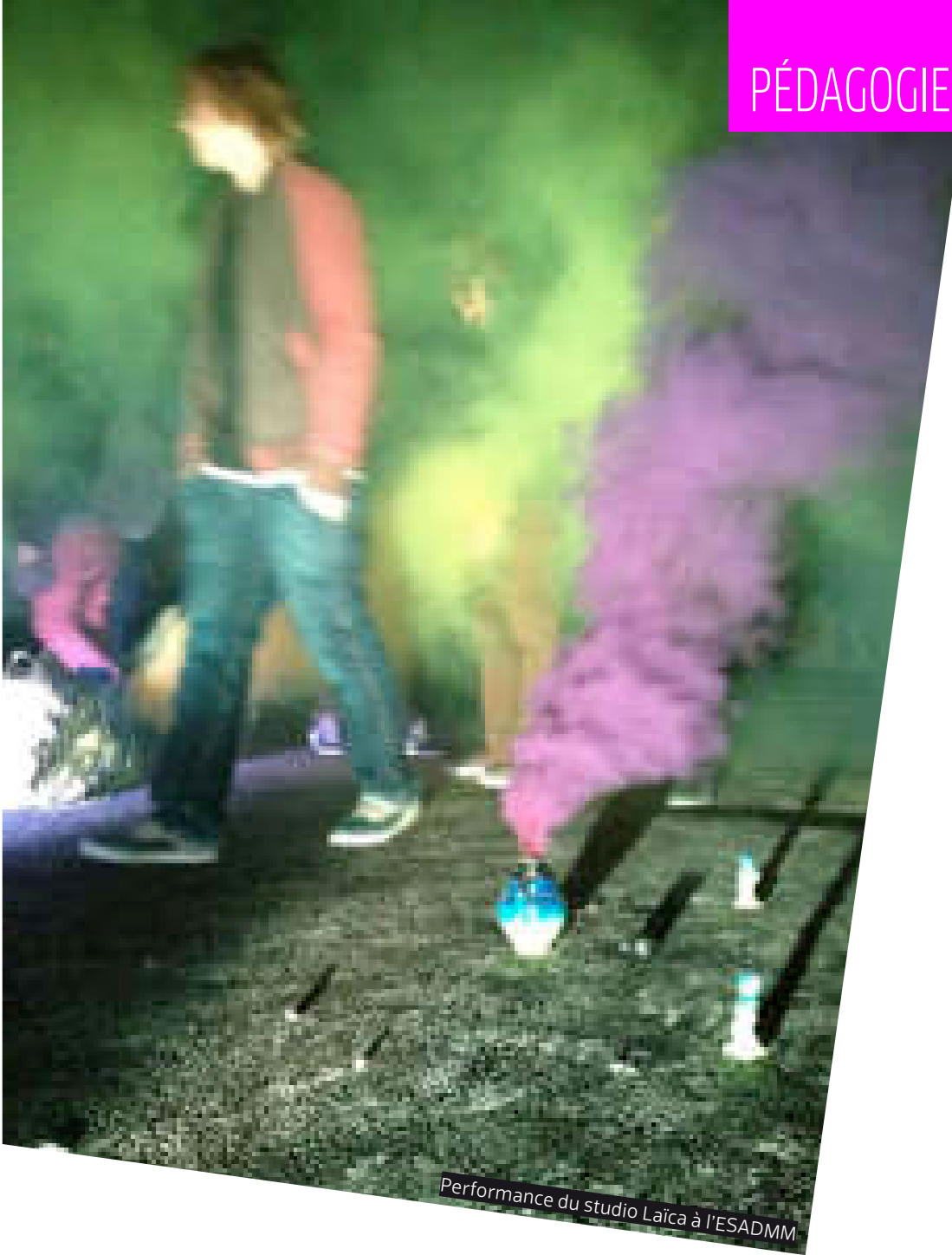
Performance du studio Laïca à l'ESADMM